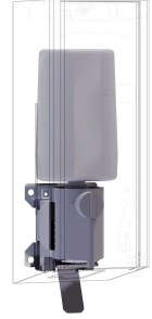
EXOS. Umrüstkit für Schaumseifenspender