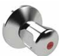
RG120 Kunststoffgriff, bis 32 mm Figur 596 16