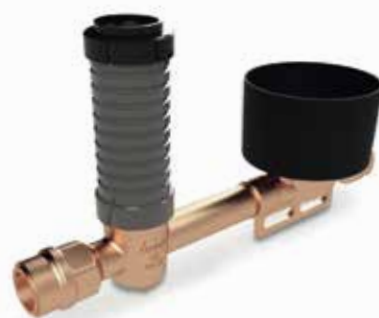
CLASSIC VAV Absperr-Wasserzähler-Kombination HWW-Modell Figur 885 27 020 Stichmaß: 153 mm

Die KEMPER Fertigmontage-Sets passend für Absperr-WZ-Kombinationen mit Unterputzventilen UP-PLUS und Absperr-WZ-Baureihe CLASSIC