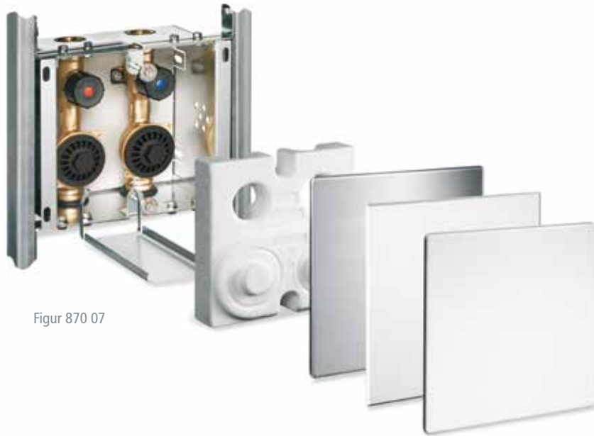
Figur 870 07

Die saubere Lösung hinter der Wand, für Register- und Vorwandmontage im Trockenbau