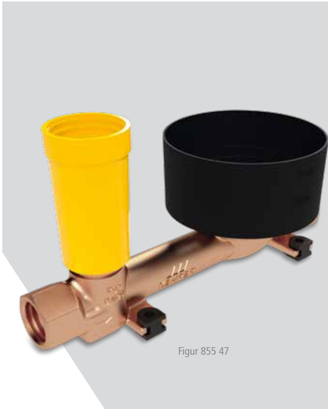
Figur 855 47