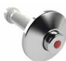
RG120 Behördenoberteil mit Verlängerung, bis 120 mm Figur 596 15