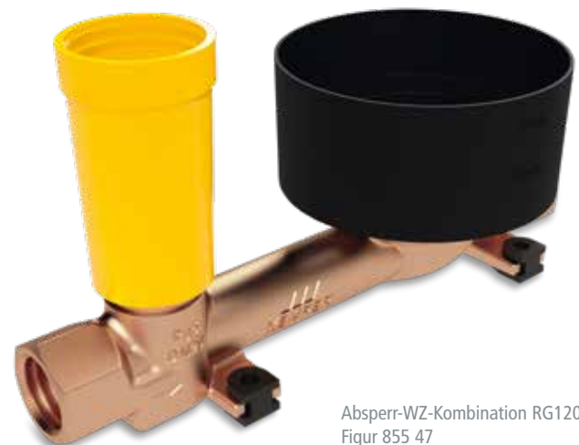
Absperr-WZ-Kombination RG120, Figur 855 47