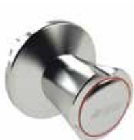
RG120 Zinkdruckgussgriff, bis 32 mm Figur 596 11