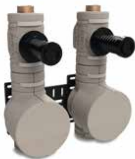
CLASSIC DUO-PLUS Absperr-Wasserzähler-Kombination HWW-Modell Figur 867 27 Stichmaß: 153 mm