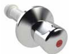
RG120 Kunststoffgriff, 30-120 mm Figur 596 17