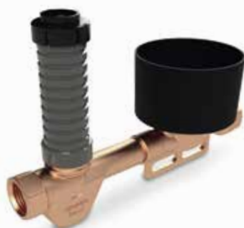
CLASSIC Absperr-Wasserzähler-Kombination HWW-Modell Figur 855 27 020 Stichmaß: 153 mm