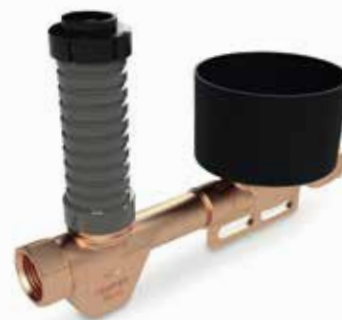
CLASSIC Absperr-Wasserzähler-Kombination HWW-Modell Figur 855 27 220 Stichmaß: 130 mm