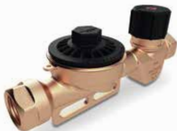
CLASSIC Absperr-Wasserzähler-Kombination HWW-Modell Figur 855 27 120 Stichmaß: 90 mm