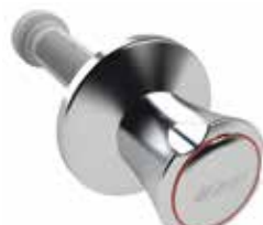
RG120 Zinkdruckgussgriff, 30-120 mm Figur 596 12