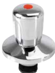
KEMPER Bediengriff Figur 590

Die KEMPER Fertigmontage-Sets passend für Absperr-WZ-Kombinationen mit Unterputzventilen UP-PLUS und Absperr-WZ-Baureihe CLASSIC